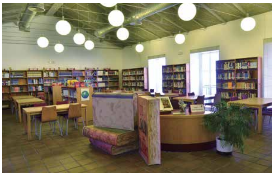
La Junta informó la propuesta de la Federación al Real Decreto que regula la remuneración a los autores por el préstamo de sus obras en bibliotecas.

Además de esta cuestión, la Junta dio su visto bueno a la firma de varios convenios y protocolos, entre ellos, el de colaboración con el Consejo Superior de Deportes para la realización de acciones conjuntas que faciliten la celebración de eventos deportivos en las Entidades Locales (más información en la página 23). ★