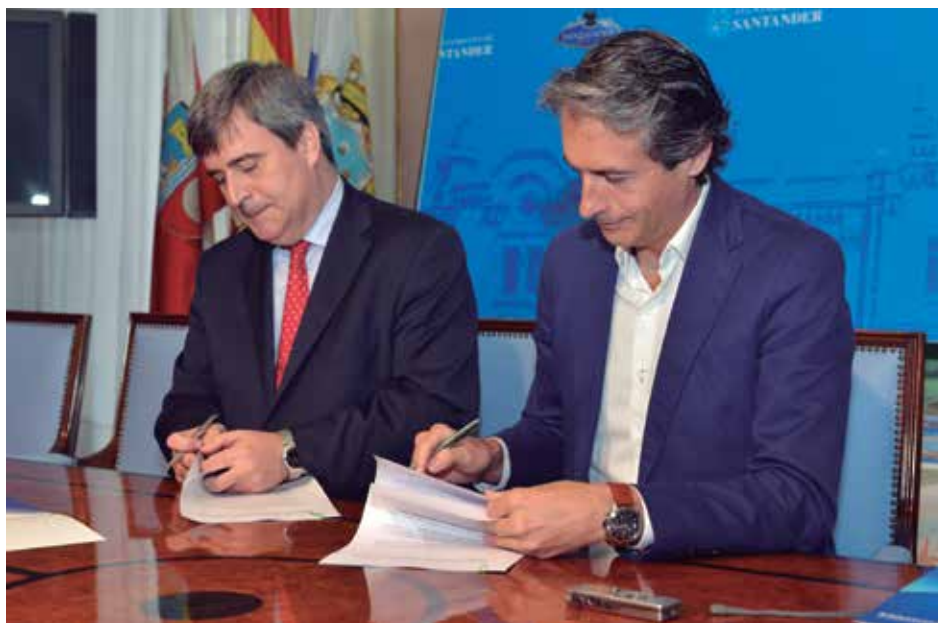
El Presidente del CSD, Miguel Cardenal, y el Presidente de la FEMP, Íñigo de la Serna, suscriben el acuerdo.

En el marco del acuerdo, que tiene una duración de un año, con posibilidad de prórroga hasta un límite de cuatro, las dos partes se comprometen a colaborar activamente para favorecer la celebración de eventos de interés y, además, a darles difusión a través de todos sus medios.★