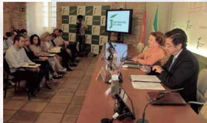
Acto de presentación celebrado en la Diputación de Jaén.

La Región de Murcia es la zona en la que se encuentra el 44,4% de las Entidades adheridas a la Central de Contratación; en su capital, y en la sede de su Federación de Municipios, se celebró el 3 de julio la jornada informativa sobre la Central de Contratación.