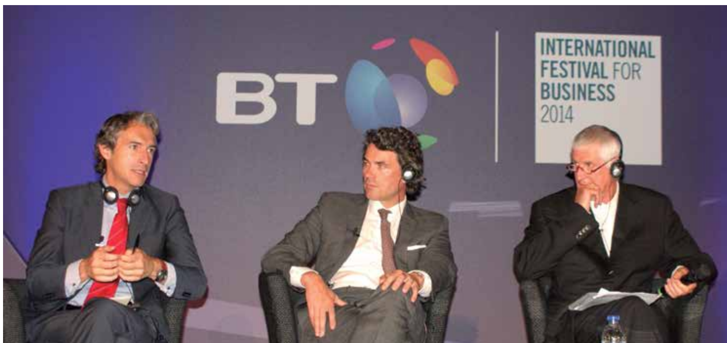
El Presidente de la FEMP interviniendo en la mesa "Ciudades para el crecimiento y la igualdad".

De la Serna indicó que la elaboración de esta propuesta se ha realizado en coordinación con la Secretaría de Estado de Telecomunicaciones